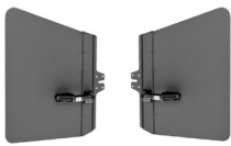
SMB-1 Side Flags K2.66274.0 (pair)