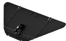
SMB-1 Top/Bottom Flag , K2.66273.0