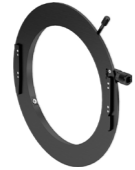
SMB-2 Back Plate 143 mm K2.0007765