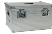
Case for SMB-2 K2.0003961