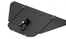
SMB-2 Top/Bottom Flag K2.0002275