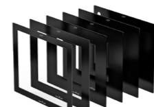
SMB-2 Mattes SPH K2.0002181