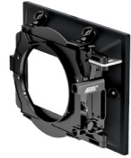
SMB-1 Basic K2.0001516