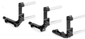
SMB-2 19mm Studio Arm K2.0001638 SMB-2 15mm Studio Arm K2.0001650 SMB-2 15mm LWS Arm K2.0002467