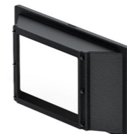
SMB-2 Sunshade ANAM K2.0002198