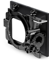
SMB-2 Tilt K2.0002256