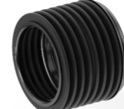
138 mm Tilting Filter Ring ø 114 mm, R2 K2.0002477