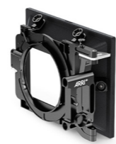
SMB-2 Basic K2.0002257