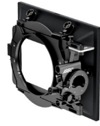
SMB-1 Tilt K2.66262.0