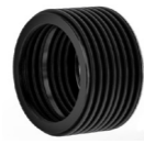
6" Tilting Filter Ring ø 150 mm R1, K2.0001174