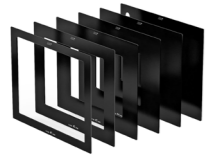
SMB-1 Mattes SPH K2.66267.0