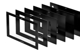
SMB-2 Mattes ANAM K2.0002228