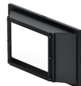
SMB-1 Sunshade ANAM K2.0001466