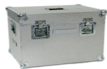
Case for SMB-1 K2.0002669 with variable dividers