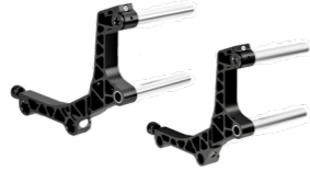
SMB-1 19mm Studio Arm K2.0006076 SMB-1 15mm Studio Arm K2.0006097